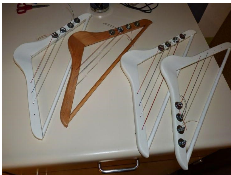
12. ábra: Fogas-hárfák