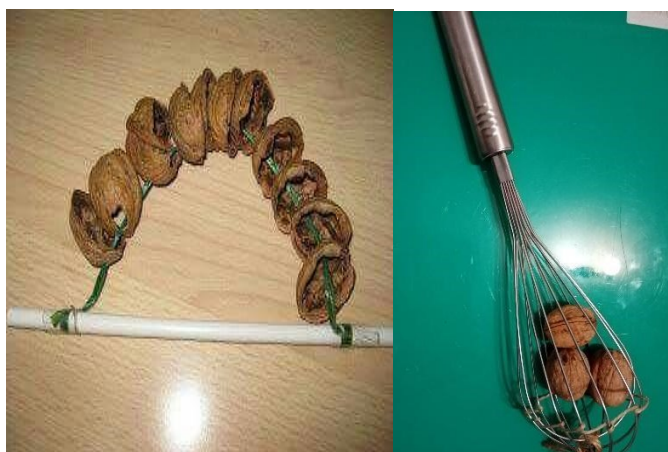
7. ábra: Csörgő dióhéjból