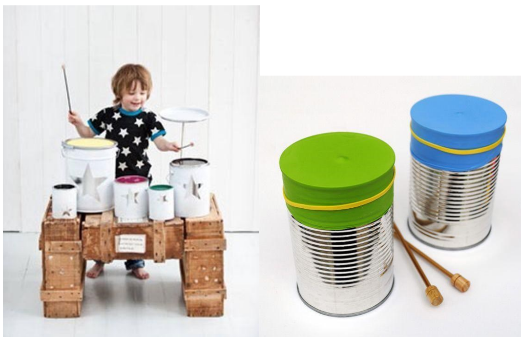
16. ábra: Dobkészlet