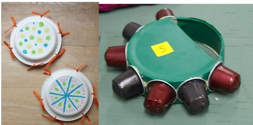
14. ábra: Rázókák és csörgők újrahasznosított anyagokból