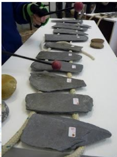
2.ábra: Metallofonok fagallyakból és kövekből