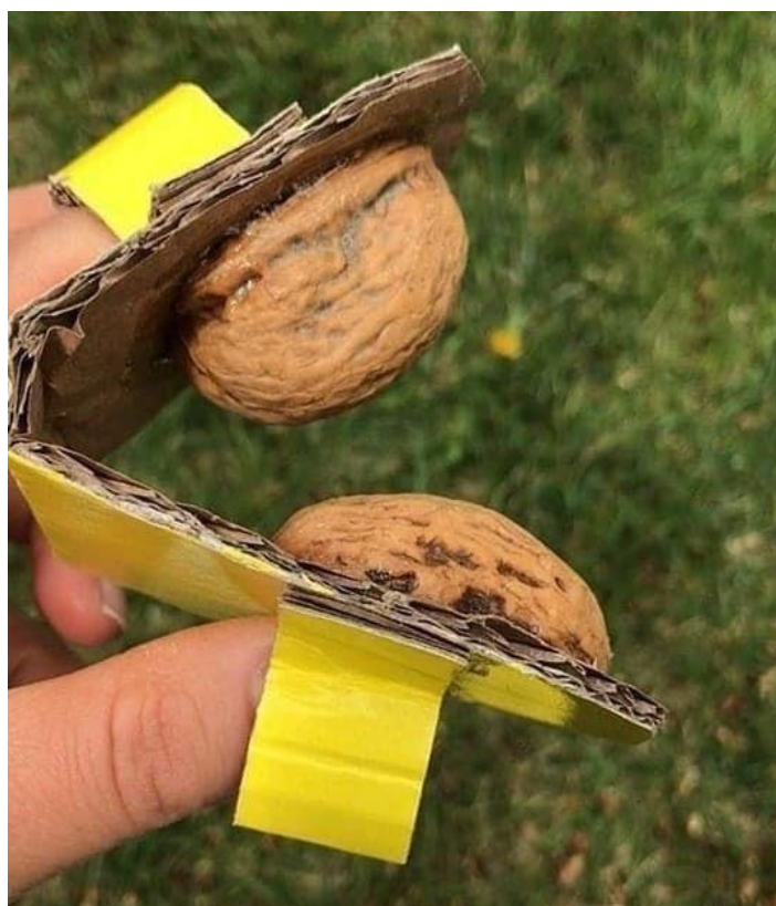
9. ábra: Ujj-kasztanyetta dióhéjból