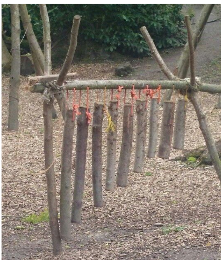
3. ábra: Szabadtéri fa-harangjáték