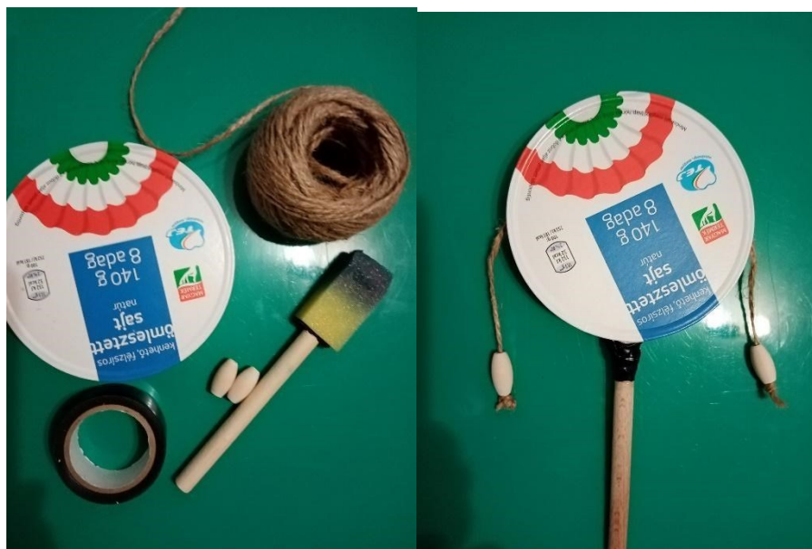
15. ábra: Dobok újrahasznosított anyagokból