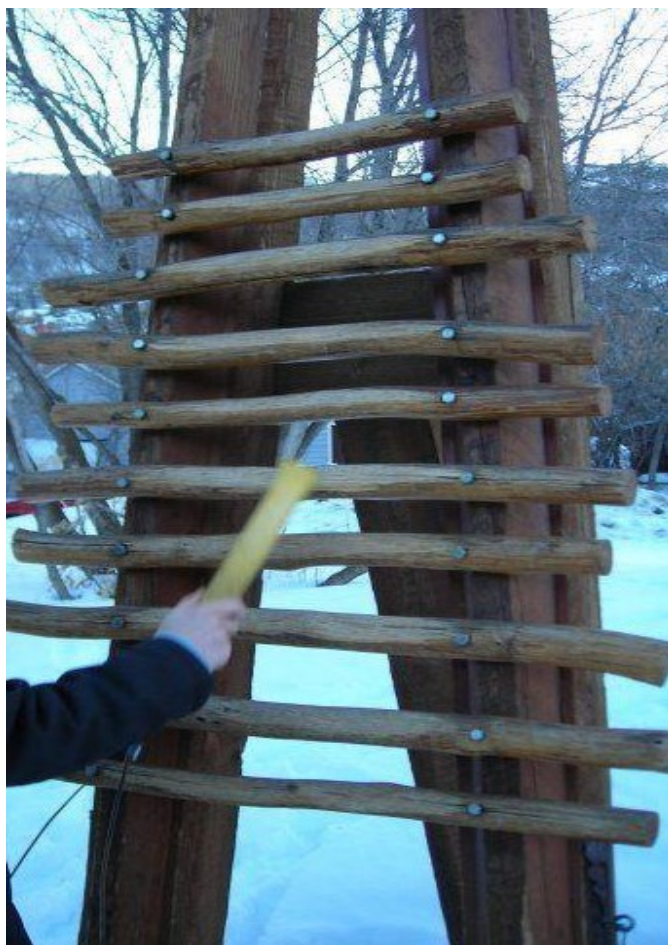
6. ábra: Szabadtéri, álló facimbalom