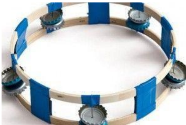
20. ábra: Csörgődob