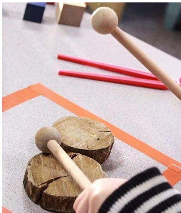
8. ábra: Kisdob vastag faágakból