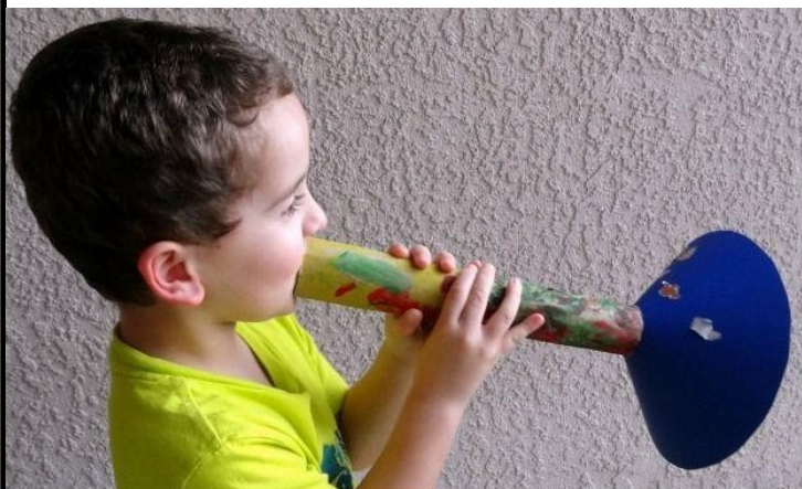
22. ábra: Pánsíp és trombita műanyag - és fürdőszobai hulladékokból