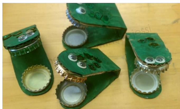
19. ábra: Ujjcintányér kupakból és hulladékpapírból