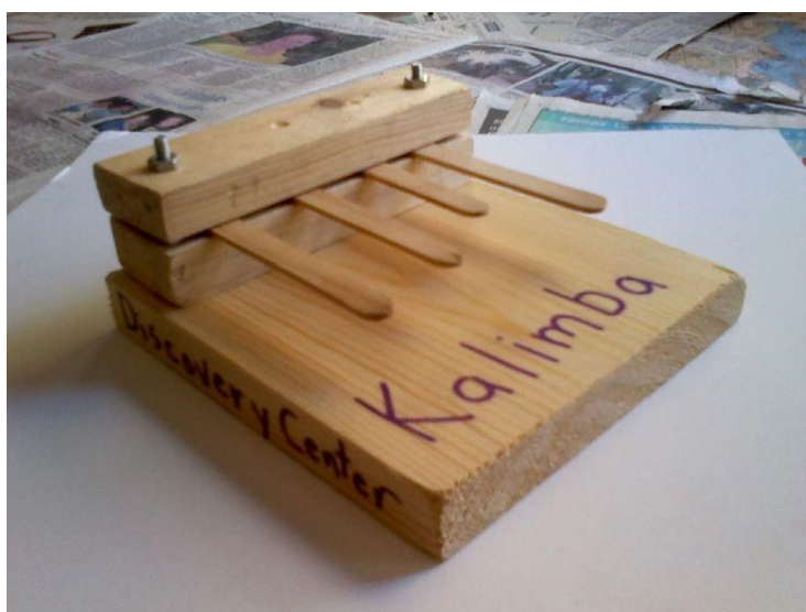
21. ábra: Barkácsolt kalimba fagyaltos pálcikákkal