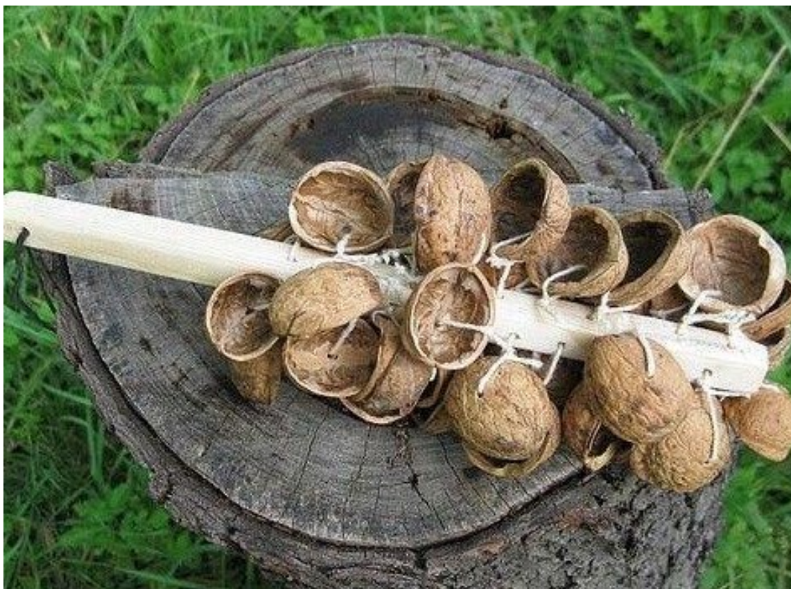
4. ábra: Rázóka dióhéjból