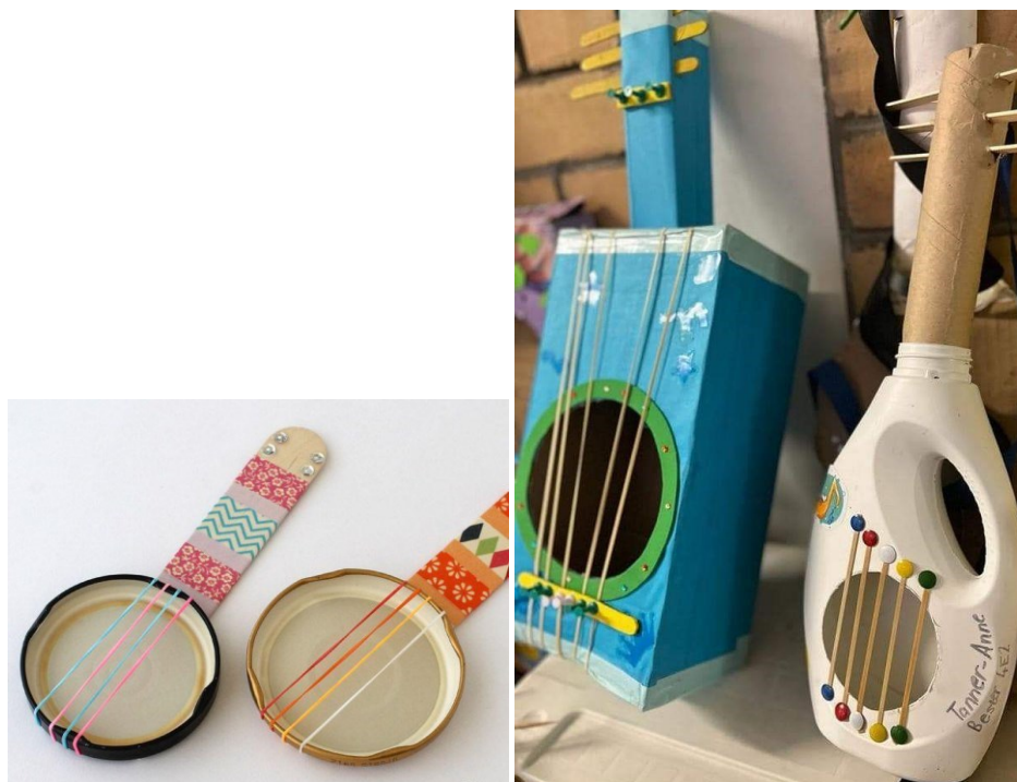
11. ábra: Gitár befőttesüvegzáró tetőkből, háztartási hulladékból, fagylaltos pálcikákból és befőttesgumbiból