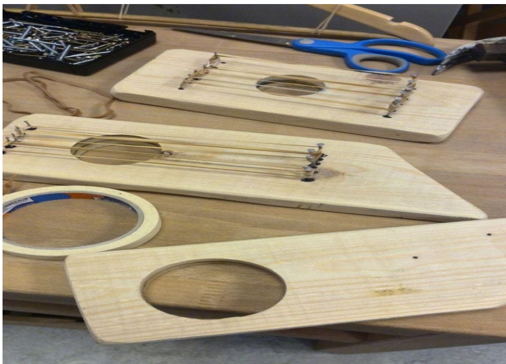
13. ábra: Barkácsolt psaltériumok