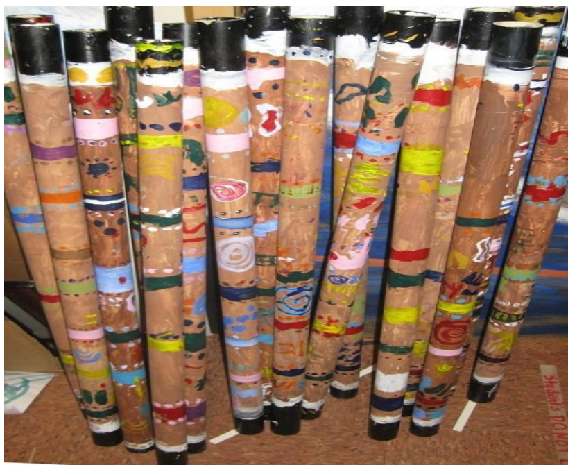
23. ábra: Esőbotok építési hulladékból