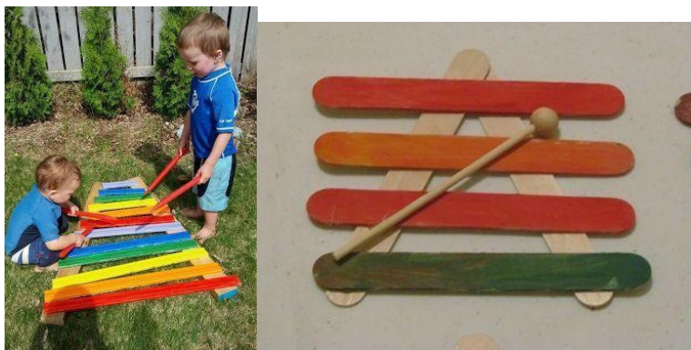
17. ábra: Facimbalmok építési hulladékból és fagylaltos pálcikákból