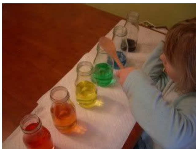
18. ábra: Víziorgona