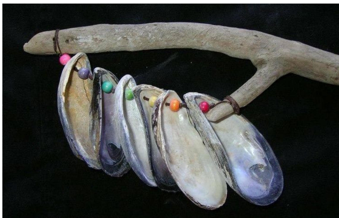
5. ábra: Rázóka kagylóhéjból