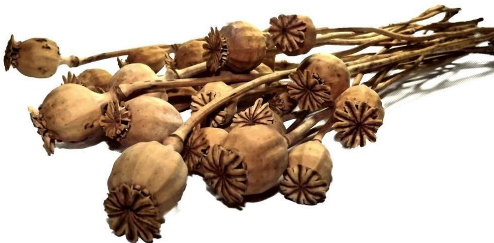
1. ábra: Mákgubó-rázóka

Ez a feladat a matematikai mérések gyakorlásánál is előnyös lehet. A shakerek, azaz 'rázókéák' nagyon egyszerűen előállíthatók. 3 Kagylók, dióhéj, kagylók tölthetők meg a természetben megtalálható apró kavicsokkal vagy magvakkal, rizzsel. A mákgubó avagy a magvakat tartalmazó száraz vagy kemény héjú termések önmagukban is ritmushangszerek. Különböző méretű csigákból, nagyobb kagylókból fúvós hangszer készíthető.